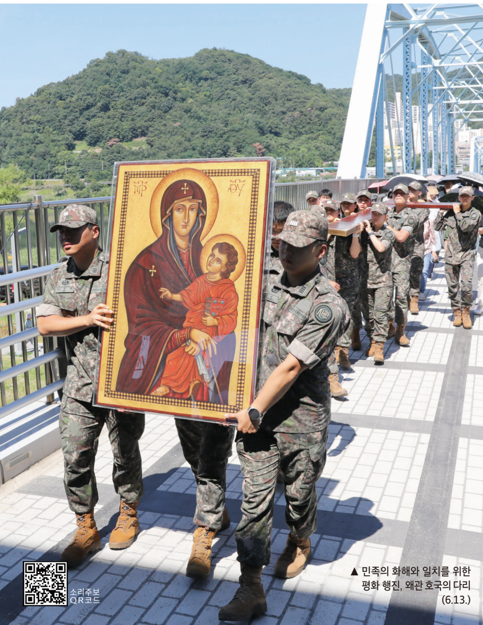
▲ 민족의 화해와 일치를 위한 평화 행진, 왜관 호국의 다리 (6.13.)

영성체송 주님, 눈이란 눈이 모두 당신을 바라보고, 당신은 제때에 먹을 것을 주시나이다.