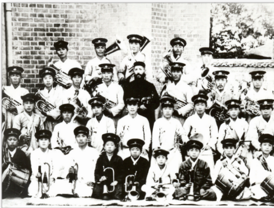
▲ 명도회 악대 - 1912. 6. 23. 주일 주교미사 때 첫 연주 기념