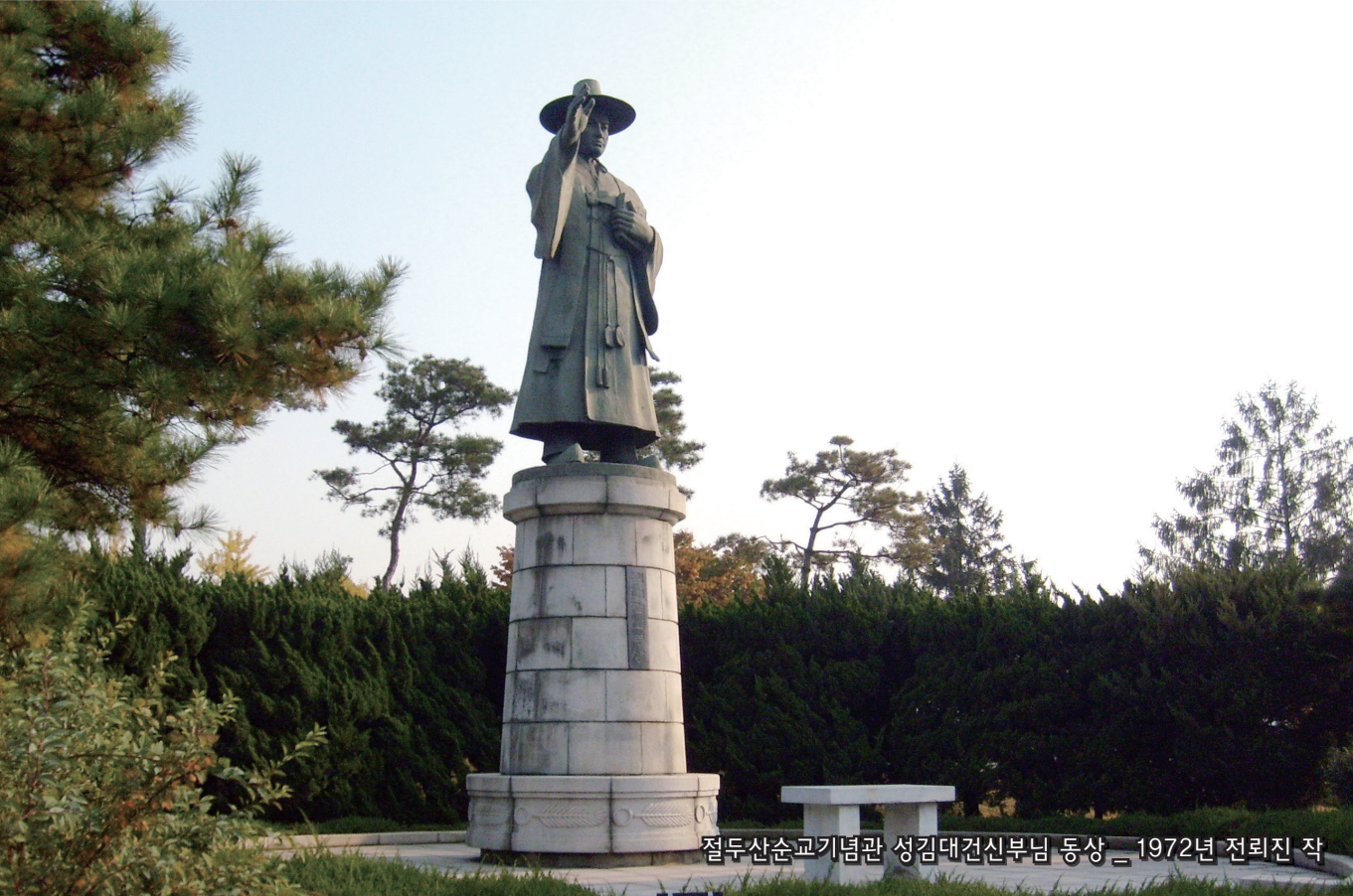
절두산순교기념관 성김대건신부님 동상 _ 1972년 전뢰진 작

편집 및 발행 | 천주교대구대교구 문화홍보실 대구광역시 중구 남산3동 225-1 (053)250-3048~9 http://www.daegu.jubo.or.kr