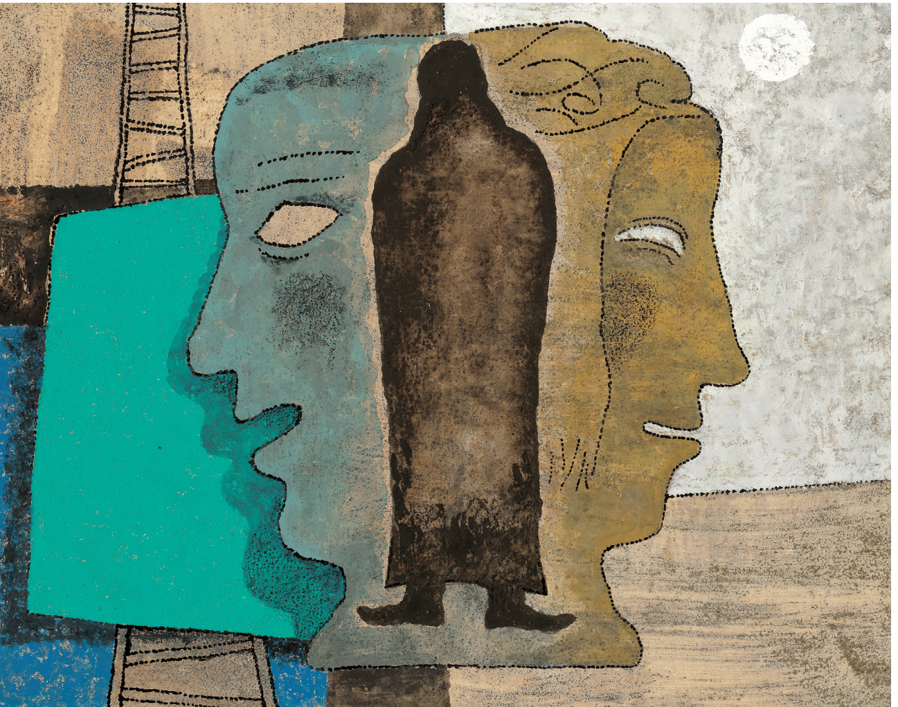
정미연 소화데레사 作

발행인 | 조환길 발행 | 천주교대구대교구 편집 | 문화홍보국 인쇄 | 대건인쇄출판사 주소 | 대구광역시 중구 남산로4길 112 전화 | (053)250-3048~9 홈페이지 | www.daegujobo.or.kr 이메일 | jubo@dgca.or.kr 등록 | 2017. 11. 13 대구 다04660