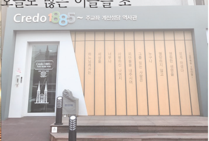
Credo188 ~ 주교좌 계산성당 역사관