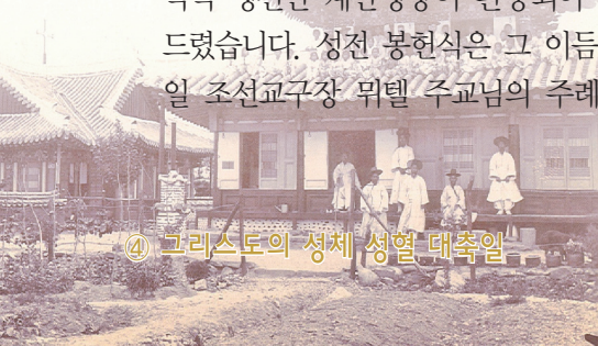
④ 그리스도의 성체 성혈 대축일

대구대교구의 심장이자 근대 대구문화의 산실인 주교좌 계산성당. 누구에게나 열린 공간이자 영혼의 안식처로 오늘도 많은 이들을 초대하고 있습니다. 믿음의 길