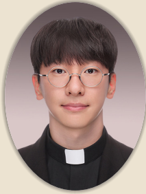
김 성 록(사도요한) 상모성당 1월 10일(수) 19:30