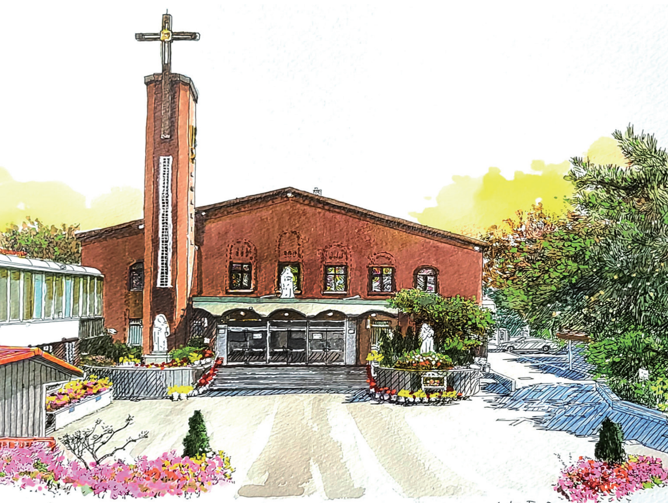
3대리구 성바울로성당 | 그림_서원만 베르나르도