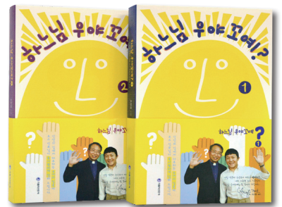
조현권 지음 | 287면, 277면 | 각 권 15,000원 | 가톨릭신문사

이 책에 실린 단상과 소고들은 2015년부터 2019년까지 월간 『레지오 마리아』에 실렸던 '사도신경에 나타난 교회의 가르침과 <공부합시다, 신앙 교리!>라는 제목의 글들을 기반으로 다른 글을 더 첨가하여 정리한 것입니다. 저자는 “하느님께 대한 신앙과 지식은 서로 상호관계를 가진다.”라고 강조하며 “하느님께 대한 지식이 깊을수록 그분을 향한 신앙도 더 깊어지고, 하느님을 향한 신앙이 깊을수록 그분께 대한 지식도 깊어진다.”라고 했습니다. 하느님을 알고 그분을 사랑하는 신앙 여정에 좋은 동반자가 될 것입니다.