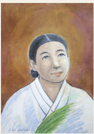
김조이 아나스타시아 (1789 ~ 1839년)

“김조이는 그 남편에게서 천주교 서적을 배웠고, 서양 선교사로부터 세례를 받았습시다. 천주교 신앙에 깊이 빠져 마음을 고칠 줄을 모르니, 참수를 하여도 오히려 죄가 남을 것입니다.”