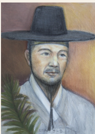
윤지현 프란치스코 (1764 ~ 1801년)

그러나 프란치스코는 끝까지 신앙을 지켰다. 그리고 의금부에서 마지막 문초를 받은 후 자신의 사형 선고문에 서명을 하였으며, 다시 전주로 이송되어 1801년 10월 24일(음력 9월 17일)에 능지처참형을 받고 순교하였다. 당시 그의 나이는 37세였다. 그가 순교한 뒤 고산에 갇혀 있던 아내와 가족들은 모두 먼 곳으로 유배되었다.