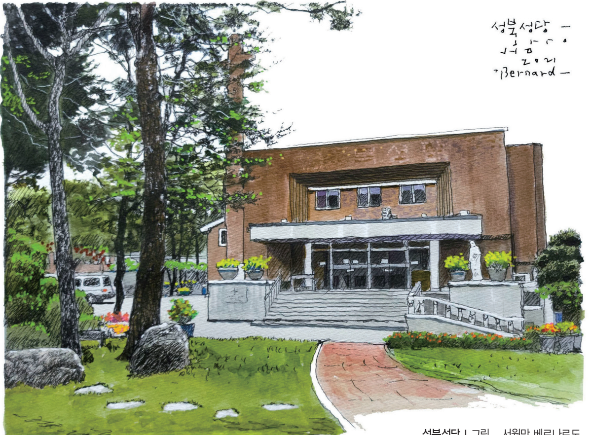
성북성당 | 그림 _ 서원만 베르나르도

한반도 평화를 염원하며 하나 된 마음으로 매일 밤 9시 주모경을 바칩시다!