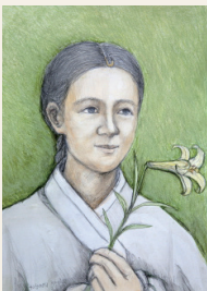
문영인 비비안나 (1776 ~ 1801년)