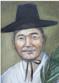
김현우 마태오 (1775 ~ 1801년)