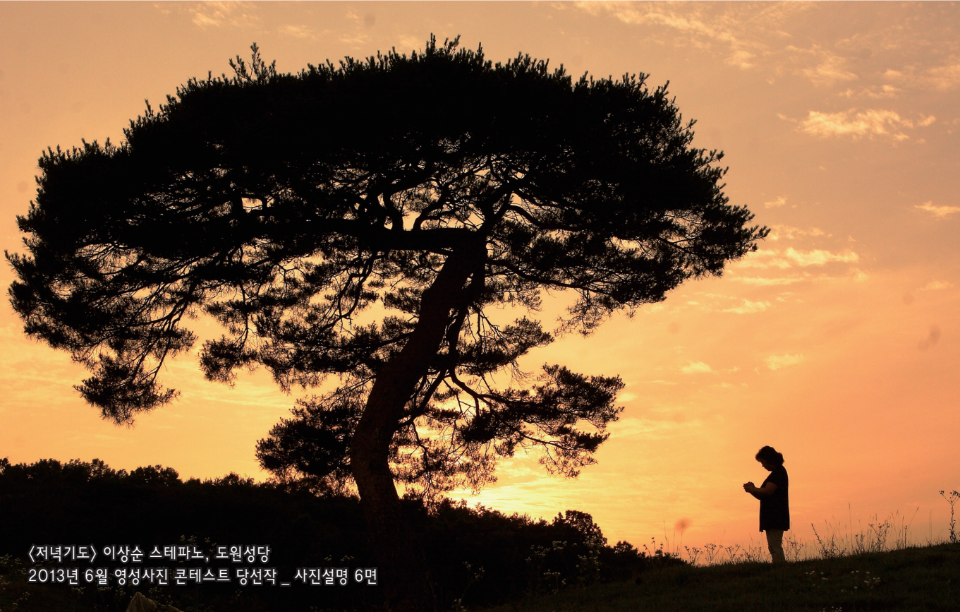
〈저녁기도〉 이상순 스테파노, 도원성당 2013년 6월 영성사진 콘테스트 당선작 _ 사진설명 6면

편집 및 발행 | 천주교대구대교구 문화홍보실 대구광역시 중구 남산3동 225-1 (053)250-3048~9 http://www.daegu.jubo.or.kr