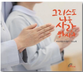
성바오로딸 수도회 노래 | 56:31 | 13,000원 | 바오로딸

소외와 단절을 살아가는 이 시대 사람들이 보이지 않는 곳에서 끊임없이 기도로 자신을 동반하는 이가 있음을 느끼고, 위로와 힘을 얻기를 바라는 마음으로 한 곡 한 곡마다 묵상과 체험을 나누며 자신의 신앙과 삶, 온 존재가 노래에 고스란히 담기도록 노력하였다. 조용히 주님 안에 머물고 싶을 때, 삶에 지친 이들이 편안한 휴식을 누리고 싶을 때 이 음반을 들으며 따뜻한 위로와 새로운 힘을 얻을 수 있다. 또한 하느님 안에서 사는 기쁨과 감사를 노래하는 수녀들의 찬양을 통해 모든 신자들이 하느님의 자녀로 살아가는 기쁨과 자유로움, 그분과 나누는 사랑에 대한 갈망을 느낄 수 있다.