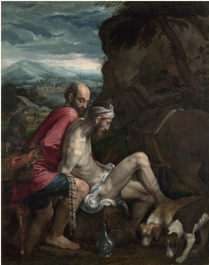
『착한 사마리아인』, 야코포 바사노, 1562~1563, 영국 런던 국립미술관

“주 너의 하느님을 사랑해야 한다. 네 이웃을 너 자신처럼 사랑해야 한다.” (마태 22,37-39 참조)