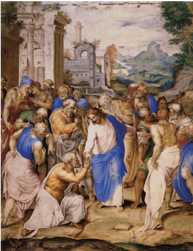
『베드로에게 열쇠를 주는 그리스도』, 지오바니 바티스타 카스텔로, 1598년, 프랑스 파리 루브르 박물관

한반도 평화를 염원하며 하나 된 마음으로 매일 밤 9시 주모경을 바칩시다!