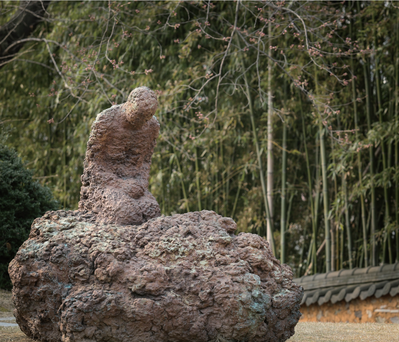
나주 순교자 기념경당