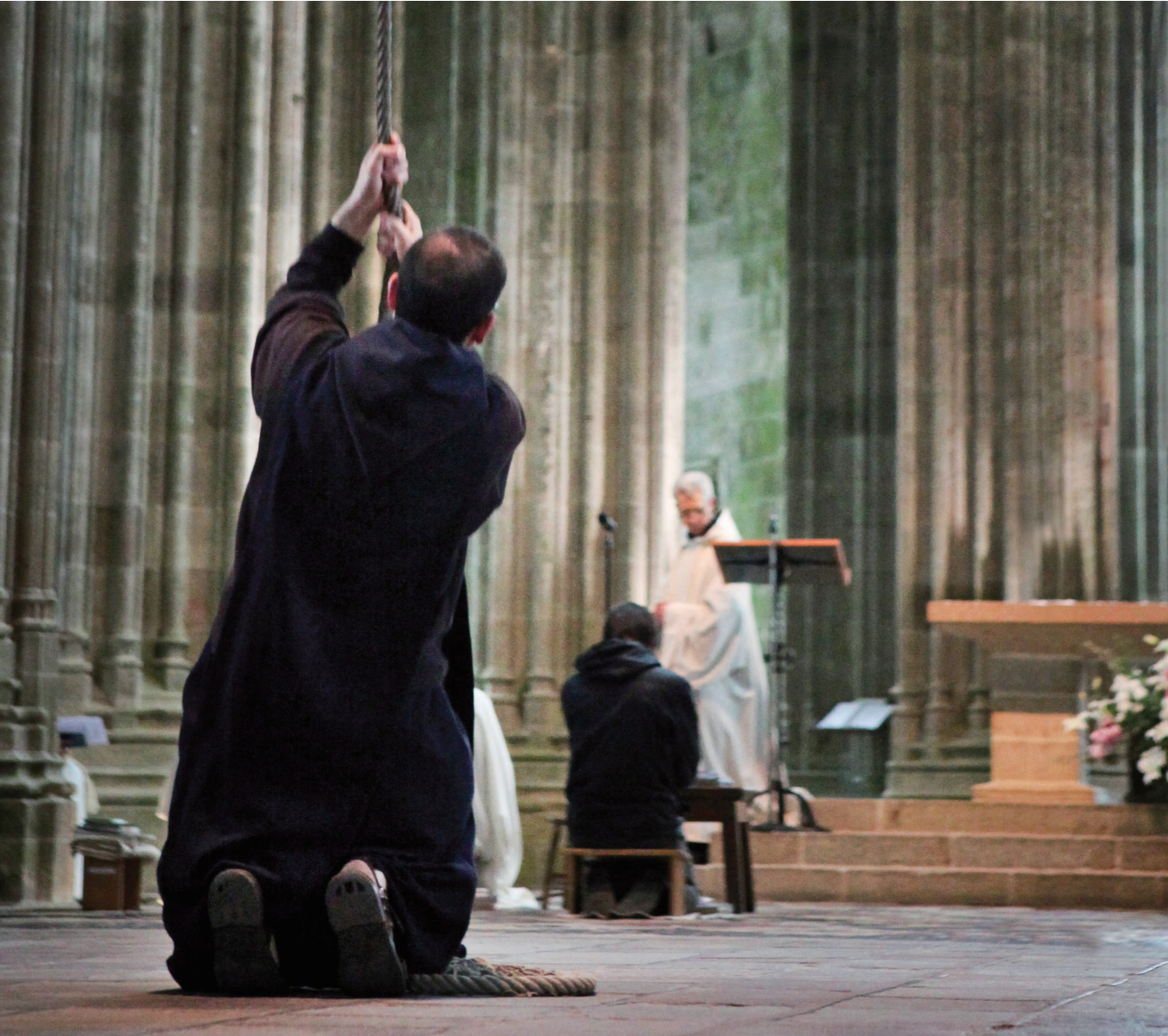
프랑스 몽생미셸 수도원 사진 / 양병주 분도

“회개하는 죄인 한 사람 때문에 하느님의 천사들이 기뻐한다.” (루카 15,10)