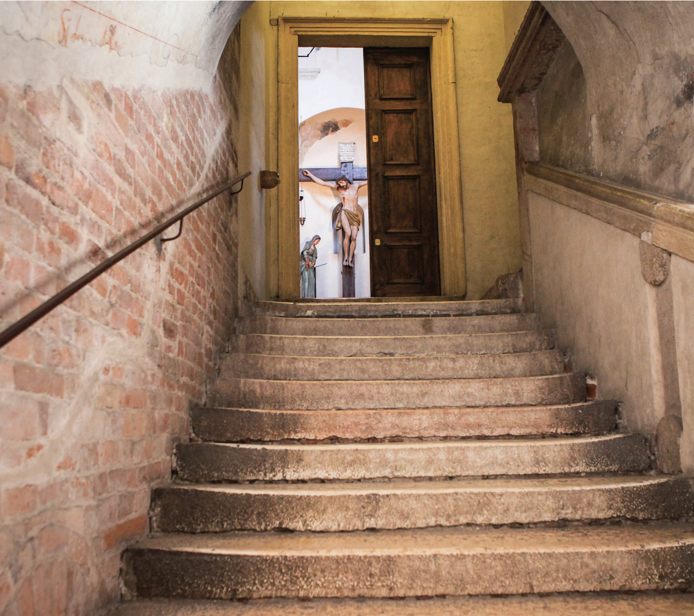
이탈리아 베로나 산 페르모 마조레 성당 사진 / 양병주 분도