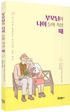
아니 보듀셀, 클로드 보듀셀 지음 이재정 옮김 | 156면 | 8,000원