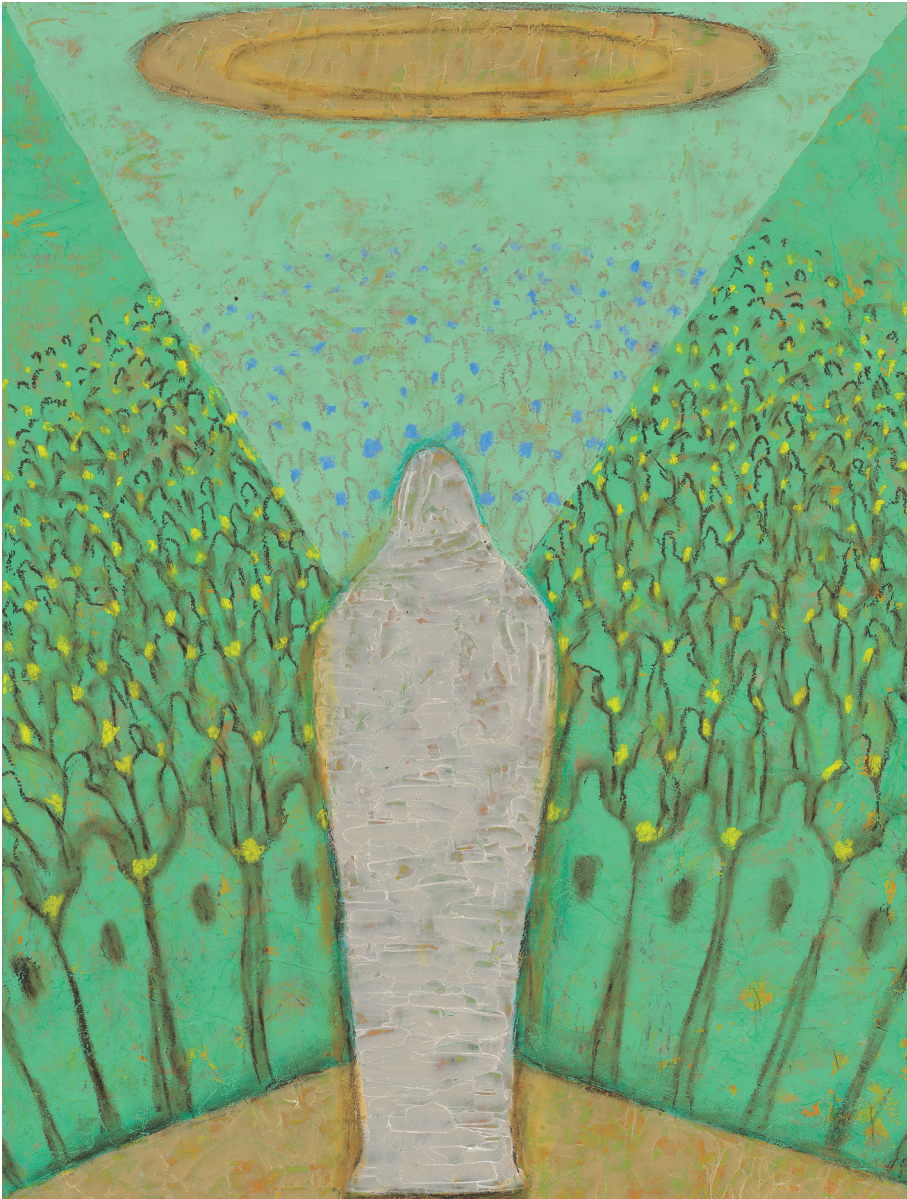
정미연 소화데레사 작

발행인 | 조환길 발행 | 천주교대구대교구 편집 | 문화홍보국 인쇄 | 대건인쇄출판사 주소 | 대구광역시 중구 남산로4길 112 전화 | (053)250-3048~9 홈페이지 | www.daegujobo.or.kr 이메일 | jubo@dgca.or.kr 등록 | 2017. 11. 13 대구 다04660