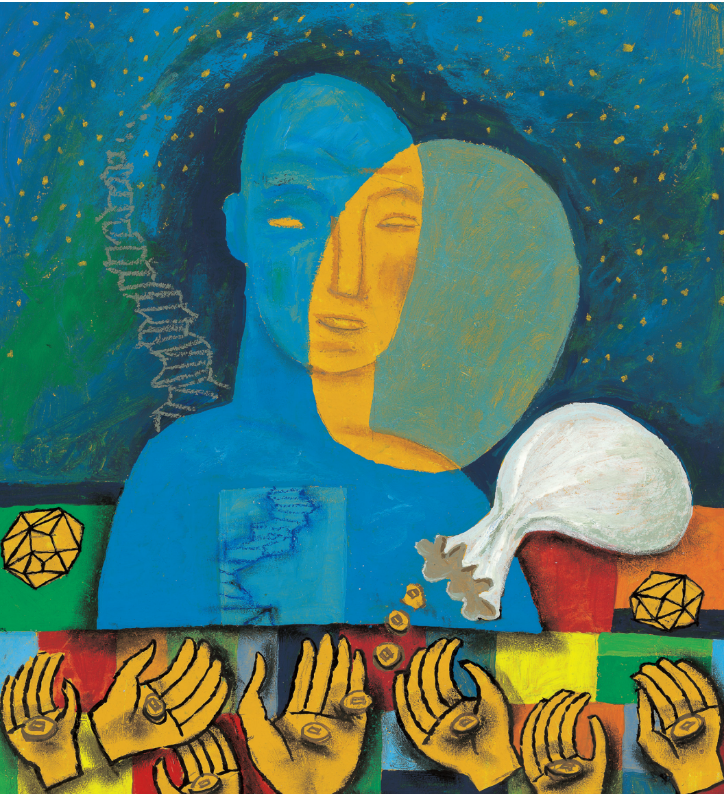
정미연 소화테레사 작

발행인 | 조환길 발행 | 천주교대구대교구 편집 | 문화홍보국 인쇄 | 대건인쇄출판사 주소 | 대구광역시 중구 남산로4길 112 전화 | (053)250-3048~9 홈페이지 | www.daegujobo.or.kr 이메일 | jubo@dgca.or.kr 등록 | 2017. 11. 13 대구 다04660