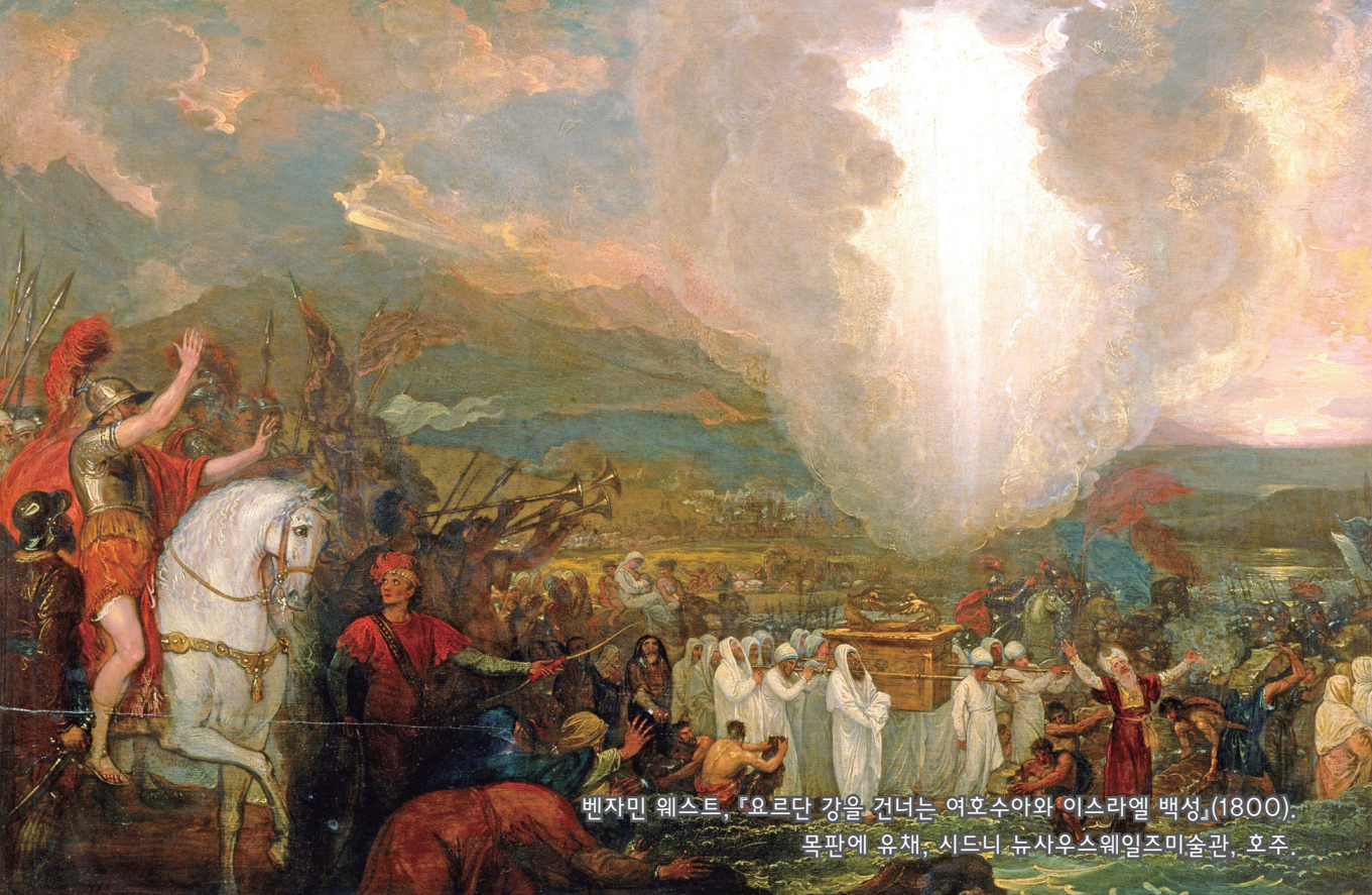
벤자민 웨스트, 『요르단 강을 건너는 여호수아와 이스라엘 백성』(1800). 목판에 유채. 시드니 뉴사우스웨일즈미술관, 호주.

편집 및 발행 | 천주교대구대교구 문화홍보실_대구광역시 중구 남산로4길 112(남산동) (053)250-3048~9 _http://www.daegu.jubo.or.kr