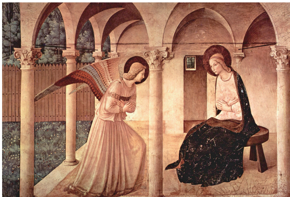
프라 안젤리코의 〈주님 탄생 예고〉는 이탈리아 피렌체의 성 마르코 대성당에 있습니다.

요한 수사(c1385~1455)의 속명은 귀도 디 피에트로였는데, 서른여덟 살에 도미니코회의 사제로 서품되면서 수도명을 요한이라 하였습니다. 불세출의 천재였지만 정작 본인은 화가로서의 명성보다는 자선을 베푸는 일에 더 관심이 많았다고 합니다. 성화를 그릴 때면 언제나 기도하였고, 완성된 그림에는 다시 손을 대는 법이 없었는데 그 이유는 “성령께서 내 손을 이끄셨다면 내 눈에 미흡해 보여도 고쳐서는 안 된다.”는 것이었습니다. 요한 수사의 모비에는 “나를 유명한 화가로 기억하지 말고, 주님의 이름으로 가난한 사람들에게 자신의 것을 다 내어놓은 수도자 요한으로 기억해 달라.”고 적혀 있습니다. 성 요한 바오로 2세 교황님께서서는 1982년에 요한 수사를 복자위에 올리시고 모든 예술가들의 수호성인으로 정하셨습니다. 필문