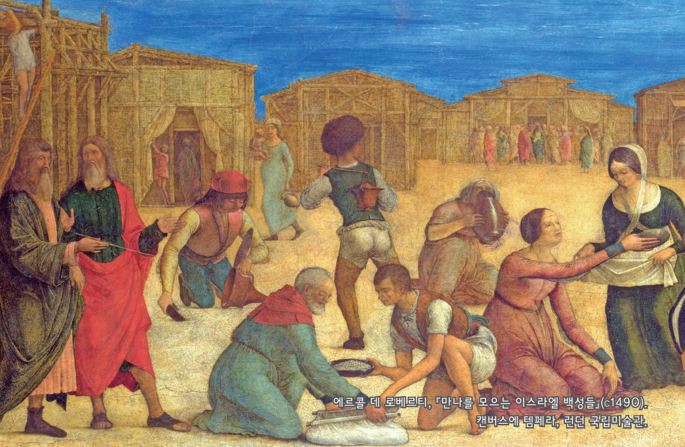
에르콜 데 로베르티, 『만나를 모으는 이스라엘 백성들』(c1490). 캔버스에 템페라, 런던 국립미술관.

편집 및 발행 | 천주교대구대교구 문화홍보실_대구광역시 중구 남산로4길 112(남산동) (053)250-3048~9 _http://www.daegujobo.or.kr