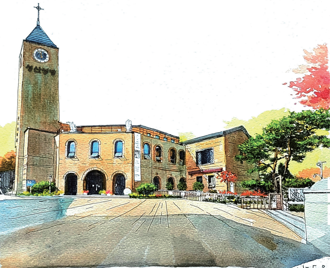
3대리구 성산성당 | 그림 _ 서원만 베르나르도