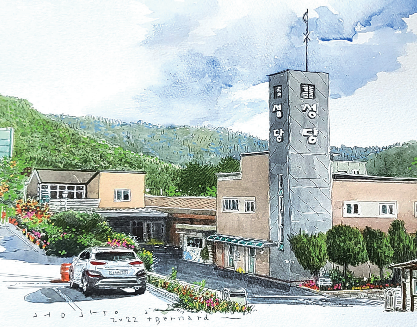
3대리구 서재성당 | 그림_서원만 베르나르도