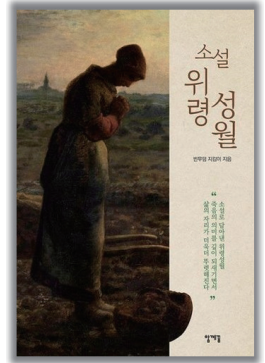
빈무덤 지킴이 지음 | 212면 | 13,000원 | 함께꿈

「소설 위령성월」은 교회가 진정한 하느님 나라를 향하는 살아 있는 여정으로 나아가기를 희망하는 창작 집단 ‘빈무덤 지킴이’의 첫 장편소설입니다. 위령성월을 거치면서 인간이 자신의 욕심 때문에 꾸며낸 거짓 믿음을 이겨내고, 진정한 믿음으로 하느님께 나아가는 여정을 그려냅니다. 이 소설의 중요한 줄기인 ‘죽음 특강’은 먼저 신자들에게 큰 위안을 주고, 죽음을 통해 하느님과 궁극적으로 만나게 된다는 점을 상기시킵니다. 아울러 어떻게 살아가는 것이 신앙인으로서 삶에 합당한지 돌아보게 합니다. 또한 위령성월은 먼저 세상을 떠난 이들을 기억하고, 지금 여기서 살아가는 자신의 삶을 돌아보게 해줍니다. 어둠을 둘러싼 많은 근심과 사건 사고를 디디면서 위령성월을 잘 헤쳐가고 대림을 맞이합니다. 소설의 형식으로 위령성월을 담아낸 이 책은 독자들이 더욱 특별한 위령성월을 맞이하고 보내는 데 매우 유용할 것입니다.