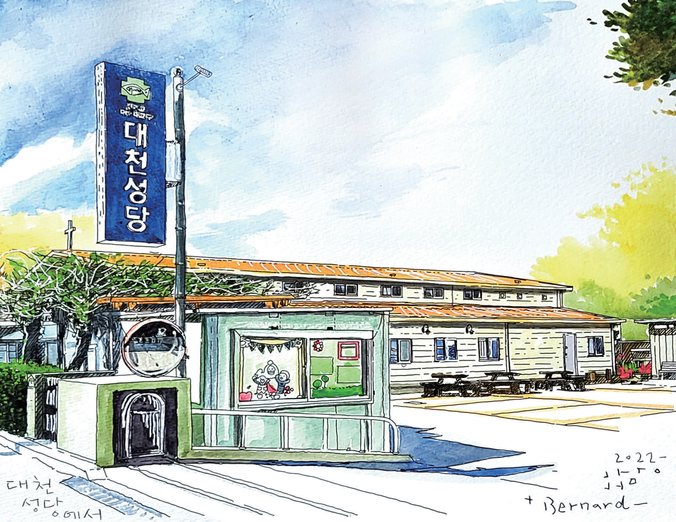
3대리구 대천성당 | 그림_서원만 베르나르도