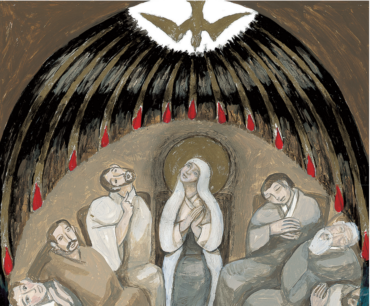
정미연 소화데레사 작

발행인 | 조환길 발행 | 천주교대구대교구 편집 | 문화홍보국 인쇄 | 대건인쇄출판사 주소 | 대구광역시 중구 남산로4길 112 전화 | (053)250-3048~9 홈페이지 | www.daegujobo.or.kr 이메일 | jubo@dgca.or.kr 등록 | 2017. 11. 13 대구 다04660