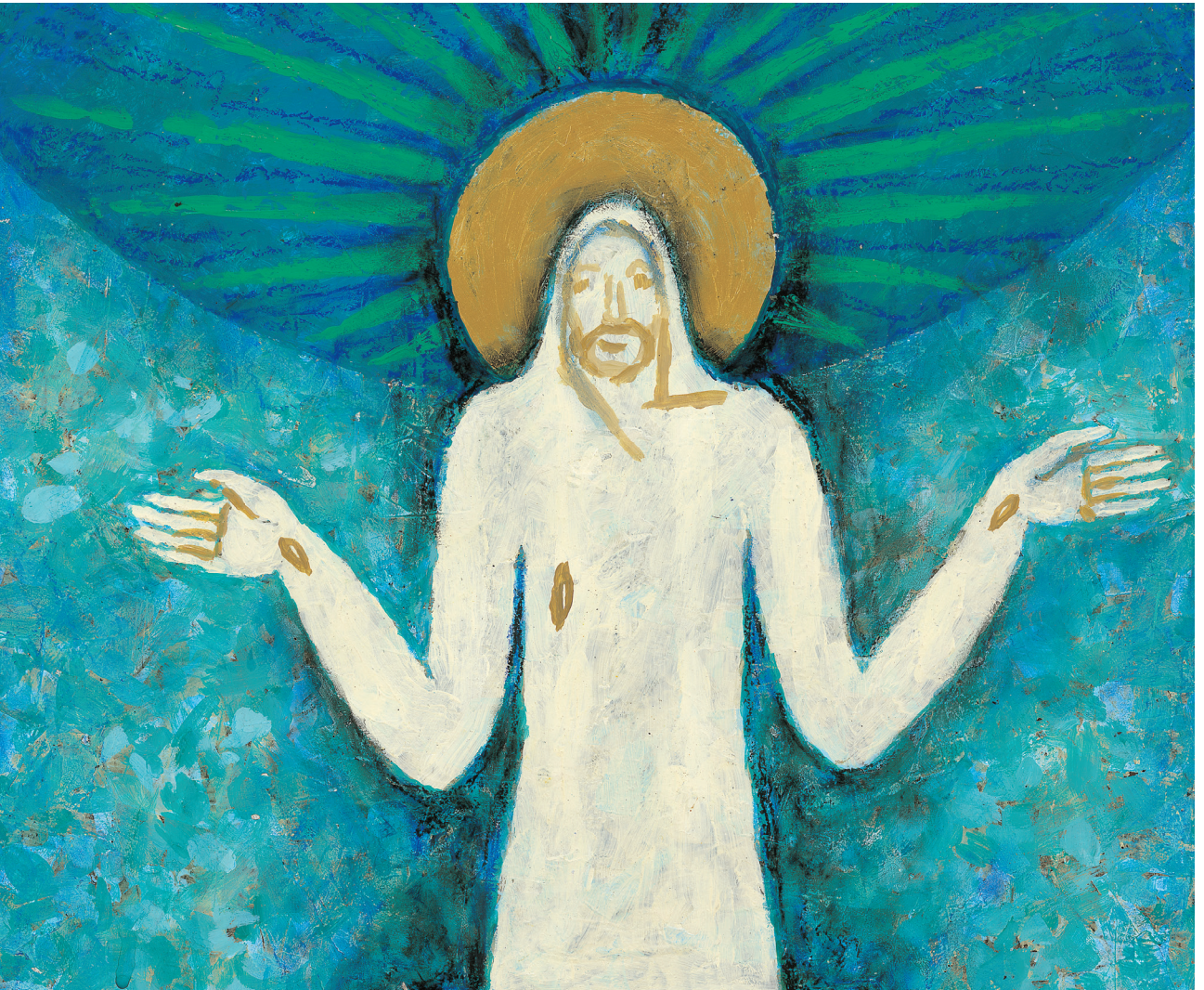
정미연 소화테레사 작

발행인 | 조환길 발행 | 천주교대구대교구 편집 | 문화홍보국 인쇄 | 대건인쇄출판사 주소 | 대구광역시 중구 남산로4길 112 전화 | (053)250-3048~9 홈페이지 | www.daegujobo.or.kr 이메일 | jubo@dgca.or.kr 등록 | 2017. 11. 13 대구 다04660