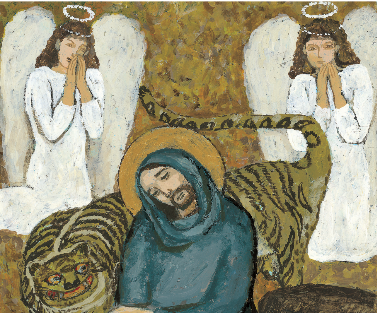
정미연 소화데레사 작

발행인 | 조환길 발행 | 천주교대구대교구 편집 | 문화홍보국 인쇄 | 대건인쇄출판사 주소 | 대구광역시 중구 남산로4길 112 전화 | (053)250-3048~9 홈페이지 | www.daegujobo.or.kr 이메일 | jubo@dgca.or.kr 등록 | 2017. 11. 13 대구 다04660